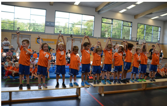
Wir waren alle starke Kinder – und starke Sieger

Für interessierte Anwesende hielten die Organisatoren einen Stand mit Informations- und Aufklärungsmaterialien und Mitgebseln für die Kinder