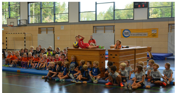
Über 200 Kinder tummeln sich in unserer Halle