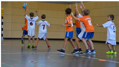
Heiß umkämpfte Partien

Turnier unter dem Motto „Kinder stark machen für ein suchtfreies Leben“, einer Aktion der Bundeszentrale für gesundheitliche Aufklärung und des Deutschen Handball Bundes. Dabei geht es darum, Kinder durch positive Erlebnisse in den Sportvereinen gegen Drogen und andere Gefahren zu stärken.