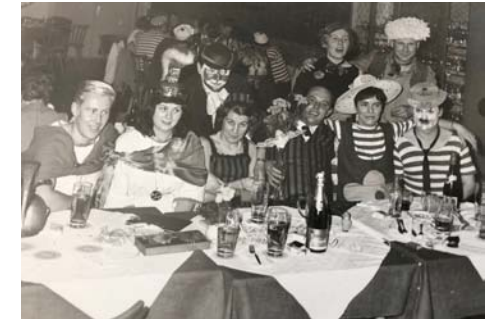
1967 beim Vereins-Maskenball im Fleischmann

- viele schöne Faschingsbälle und Sommerbälle im Strandhotel Fleischmann (s. Bild)