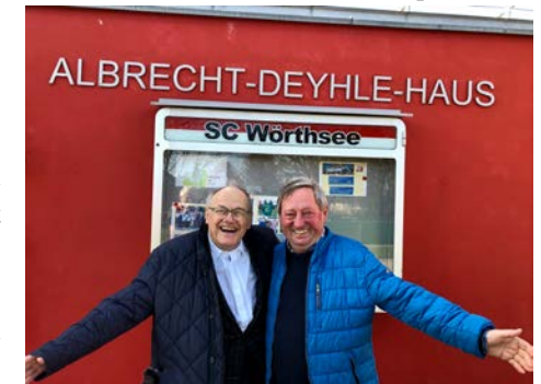
Ein erfolgreiches Tandem

Für den SC Wörthsee wurde am 1. Oktober 2006 ein Traum wahr: der Bau des lang ersehnten Vereinsheims war realisiert! Vom ersten Ideenworkshop im August 2003 bis zur Einweihung am 1. Oktober 2006 vergingen nur 3 Jahre. Und das Beste war: das neue Vereinsheim konnte ohne öffentliche Subventionen gestemmt werden, denn die Gemeindekassen waren seinerzeit leer. „Nur der Tierschutzverein bekam noch etwas, damit die Gemeinde keine streunenden Hunde aufnehmen musste“, erinnert sich Herbert Gerber schmunzelnd.