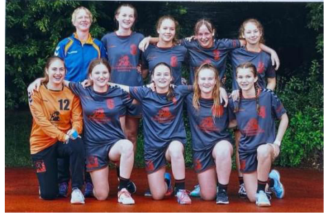
unsere weibliche B-Jugend beim Turnier in Forstenried

Falls ihr Lust habt auf eine coole Truppe und bisschen Handball würden wir uns voll freuen euch beim Training zu sehen. Ihr könnt zum Beispiel so coole Sachen wie das Rasenturnier in Forstenried erleben. Turniertage hatten wir wegen Corona lange nicht mehr und wir haben uns alle mega auf den Tag gefreut. Auch die schlechte Wettervorhersage hat uns den Spaß nicht zerstört. Das erste Spiel stand gegen 9 Uhr an und bevor unsere B-Jugend um 10 Uhr ran musste, haben sie die C-Jugend bei ihrem ersten Spiel ordentlich angefeuert. Die "Kleinen" haben sich trotz Regen wacker geschlagen und ihr erstes Spiel gewonnen. Es gab ordentlichen Jubel und erstmal was zu essen für die Gewinner.