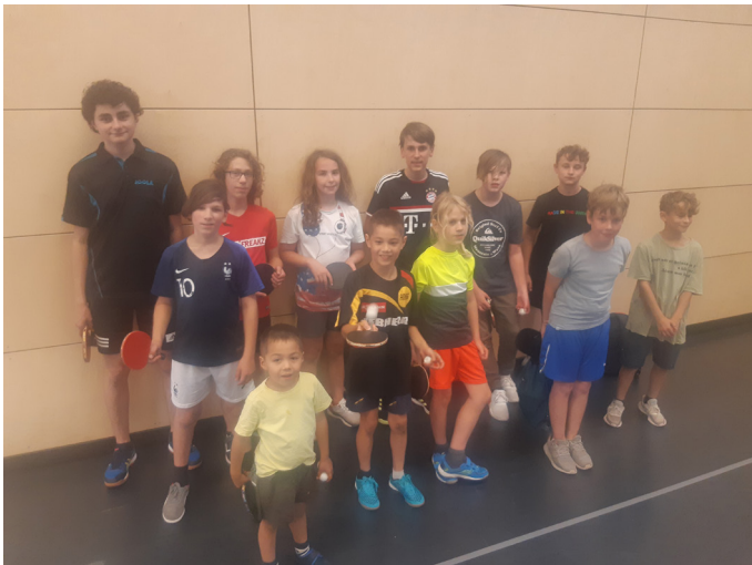
Auch im Juli war nach der so langen Pause die Trainingsbeteiligung absolut rege

30./31.10. Bezirkseinzelmeisterschaft Erwachsene in Peiting