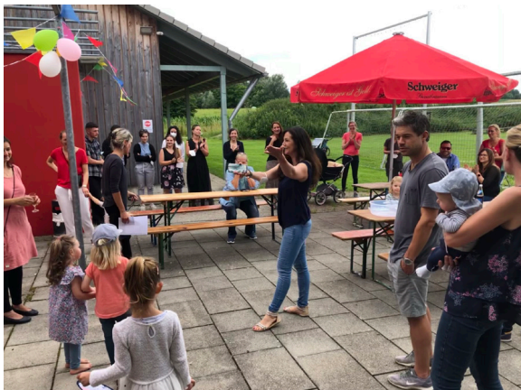
Eine von vielen Feiern im ADH: hier die Kindergrippe

Vereinsmitglieder und unser schönes ADH waren.