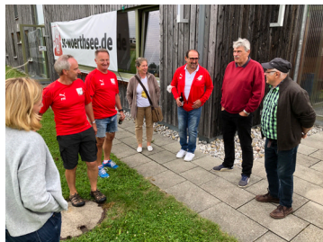
Gespräche mit den Jubilaren

Harry die 2. Herrenmannschaft sowie die A-Jugend des Vereins.