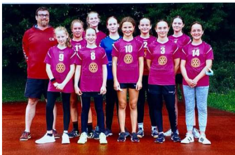
unsere weibliche C-Jugend beim Turnier in Forstenried