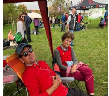
Nach 5,4 km erstmal eine wohlverdiente Pause bei den SC Wörthsee Bahnhofsviertlern