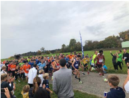
Um Punkt 12 Uhr fiel der Startschuss zum 38. Landkreislauf in Andechs.