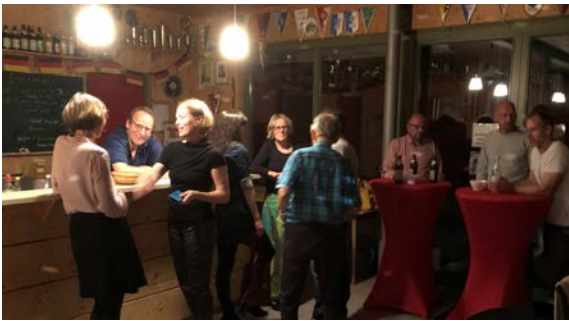
Gemütlicher Ausklang an der „tanzbar“