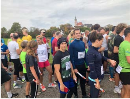
Am Fuße des heiligen Berges bereiteten sich die 154 Startläufer auf die erste Etappe vor.