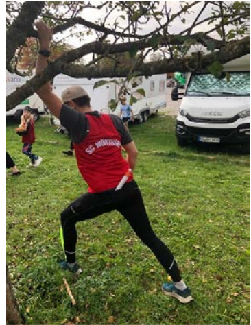
Erste Herbstkälte und dann Regen: Da war gutes Aufwärmen angesagt.

Wie immer hat es riesigen Spaß gemacht und wir freuen uns bereits auf nächstes Jahr, den 39. Starnberger Landkreislaf. Dieser findet nach 2001 und 2015 zum dritten Mal in Hechendorf statt, also bitte vormerken: Samstag, den 14.10.2023